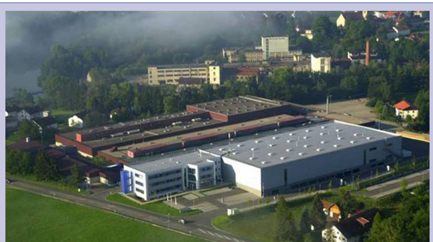
Das Firmengelände der SRI Radio Systems in Durach bei Kempten mit dem Logistikzentrum der BLG.

BLG LOGISTICS steht für internationale Netzwerke in den Geschäftsbereichen Automobil-, Kontrakt- und Containerlogistik. Weltweit bietet die Unternehmensgruppe mehr als 15.000 Arbeitsplätze. Mitte der 1990er Jahre wandelte sich die BLG vom 1877 gegründeten lokalen Hafenumschlagsunternehmen in Bremen und Bremerhaven zum international engagierten Logistikdienstleister – zur BLG LOGISTICS GROUP – mit einer Vielzahl von Töchtern und Beteiligungen auf mehreren Kontinenten.