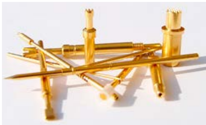
Auszug aus den Produktbereichen Kontaktstifte

parentes Management. Auch Mehrwerte wie die Netzwerksegmentierung wurde in das Konzept eingearbeitet. Bei der Konzeptionierung standen Redundanz und höchste Verfügbarkeit der Infrastruktur im Vordergrund. Die perfekt aufeinander abgestimmten, hochmodernen Komponenten gewährleisten einen hohen Investitionsschutz. Darauf aufbauend wurde im Bereich der Sicherheit die Cisco Identity Services Engine (ISE) beauftragt.